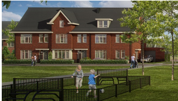
Woningtype D1, D2, D3