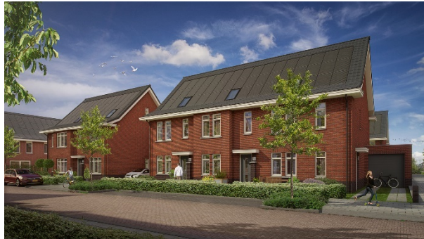
Woningtype E1, E2 en E3